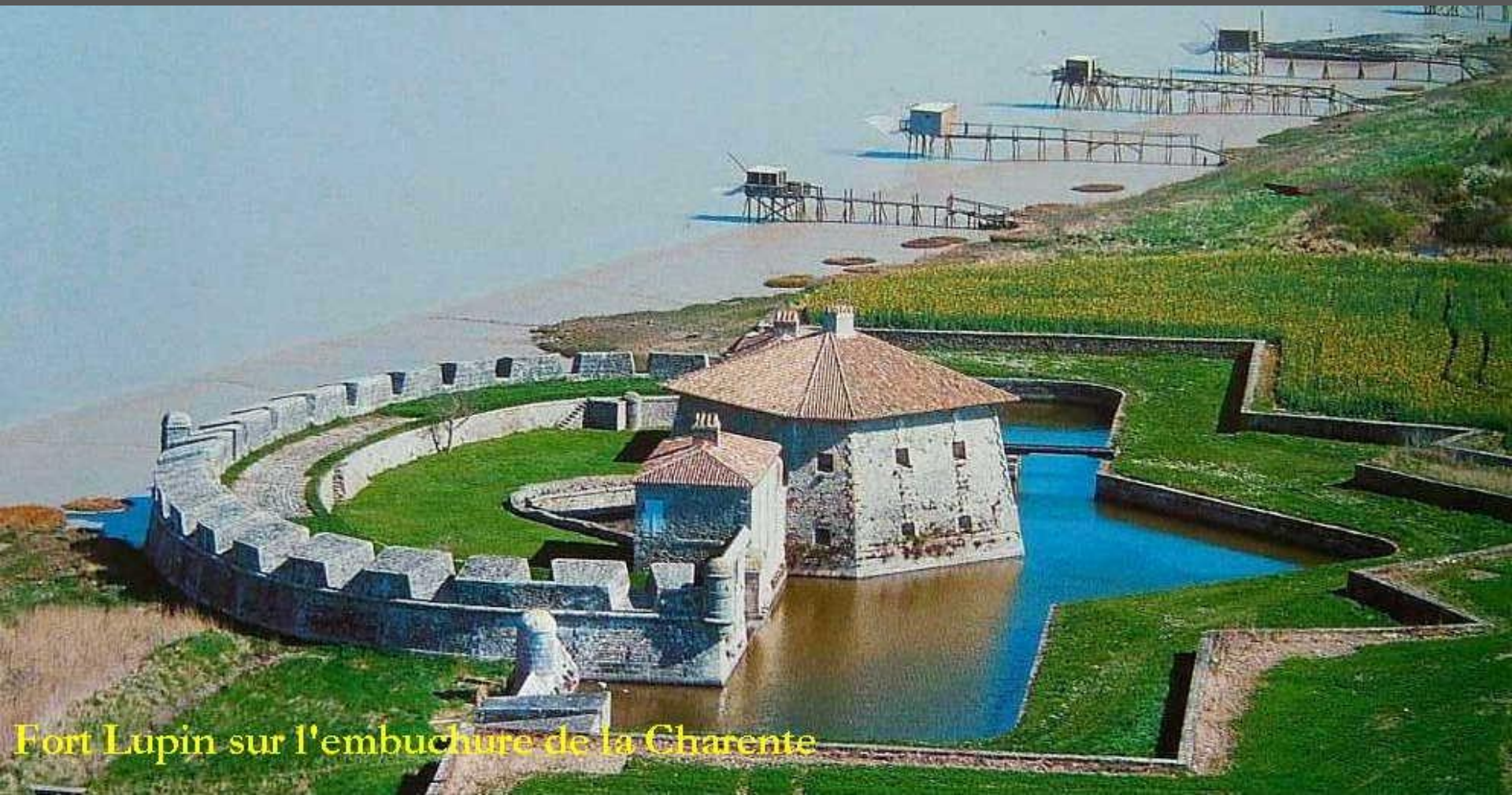
Fort Lupin sur l'embouchure de la Charente