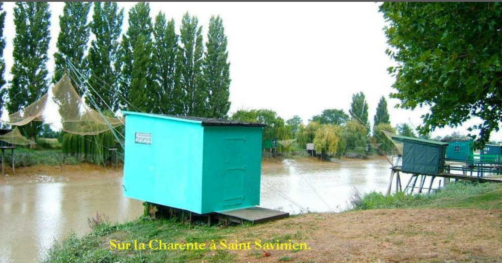
Sur la Charente à Saint Savinien.