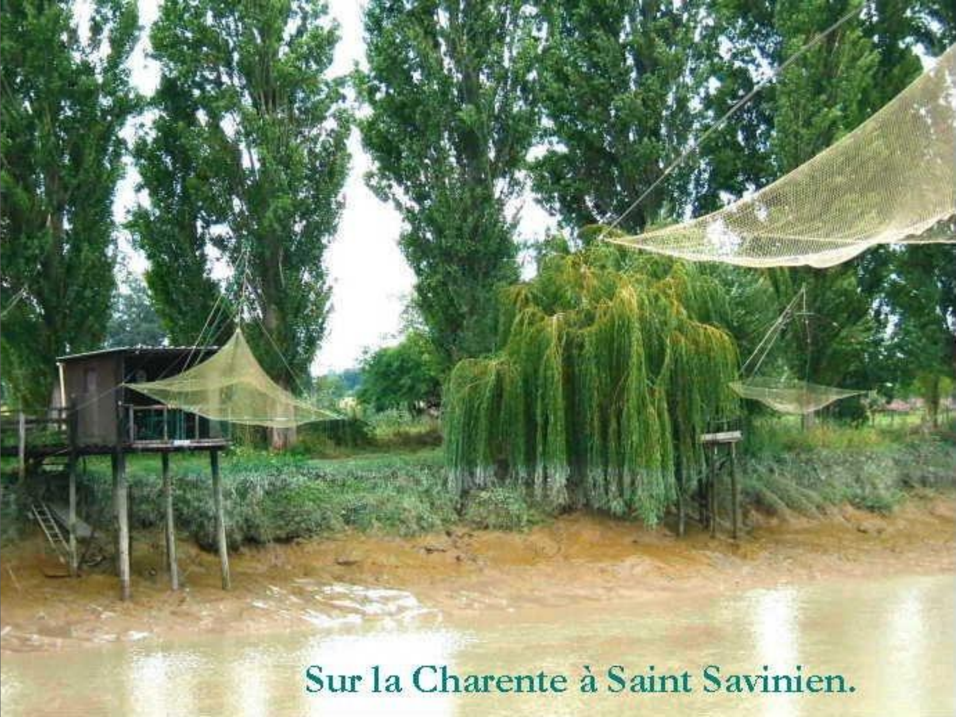
Sur la Charente à Saint Savinien.