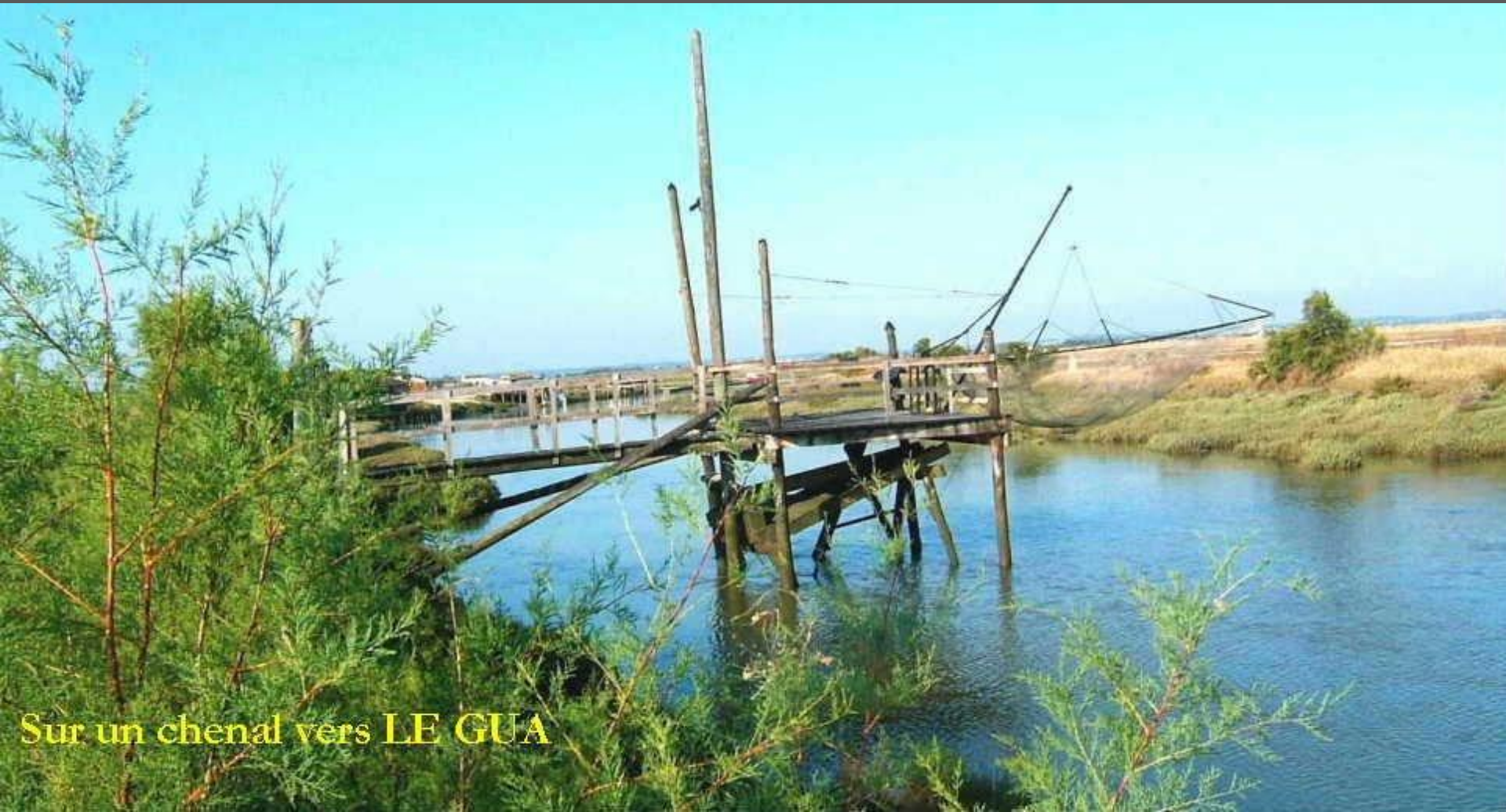
Sur un chenal vers LE GUA