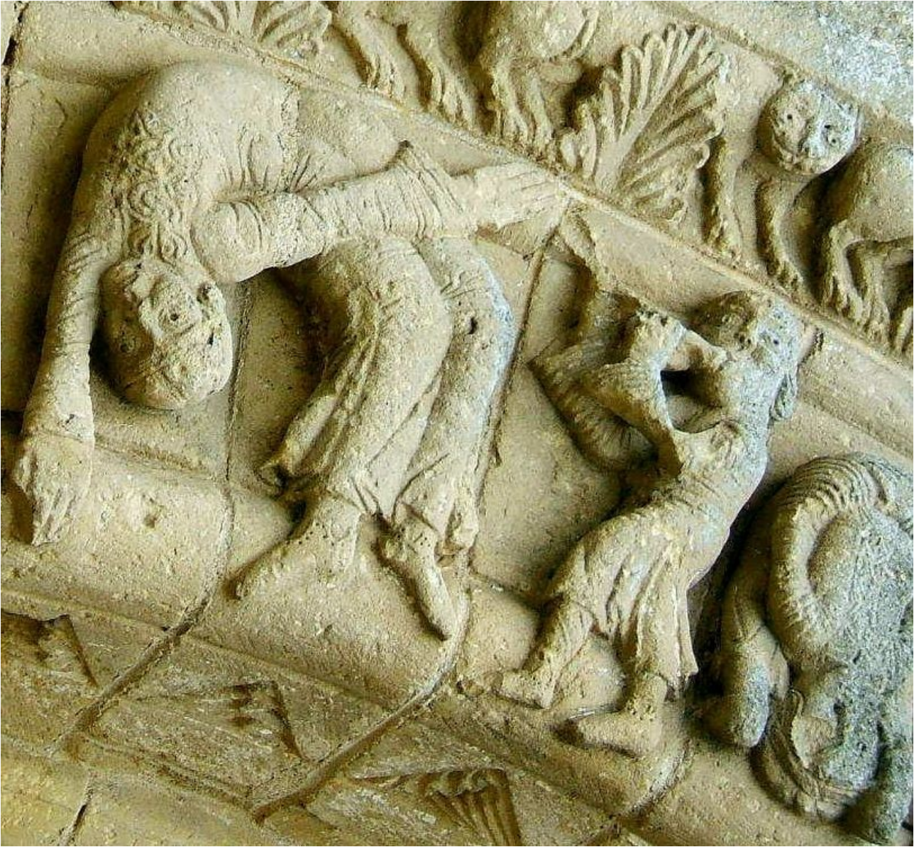
Les jongleurs à l'église de FOUSSAY en Vendée .