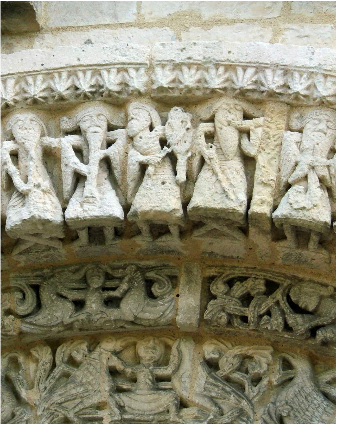
Les barbus du portail de l'église d'AVY en Charente-Maritime près de la ville de Pons