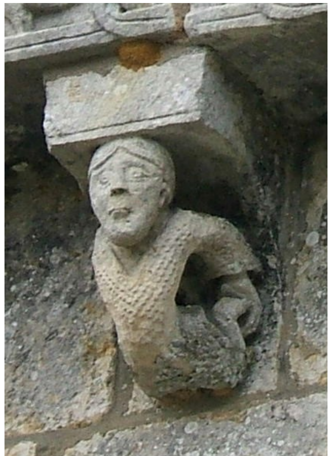
RIOUX (17) et ANNEPONT (17)

Condamné pour avoir refusé de sacrifier et prier les idoles, Daniel fut sauvé par sa foi. Ainsi en est-il de celui qui montre sa maîtrise de sa marche vers le ciel, tel l'acrobate qui se tient les jambes.