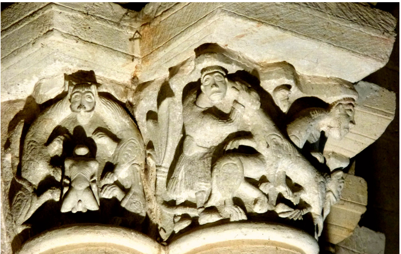
A PUYPEROUX en Charente cette âme bien masculine est sous l'emprise de ses sens. Elle veut faire l'acrobate et contrôler sa marche vers le ciel ( ses mains sur ses pieds ) mais cela semble bien compromis, car elle est comme prisonnière!

Le chapiteau suivant explicite sa situation: de par son affection pour les léonins ( les forces viriles ) le moine dont l'âme est présentée, a fait un mauvais choix ( l'« X » formé par les corps des léonins )