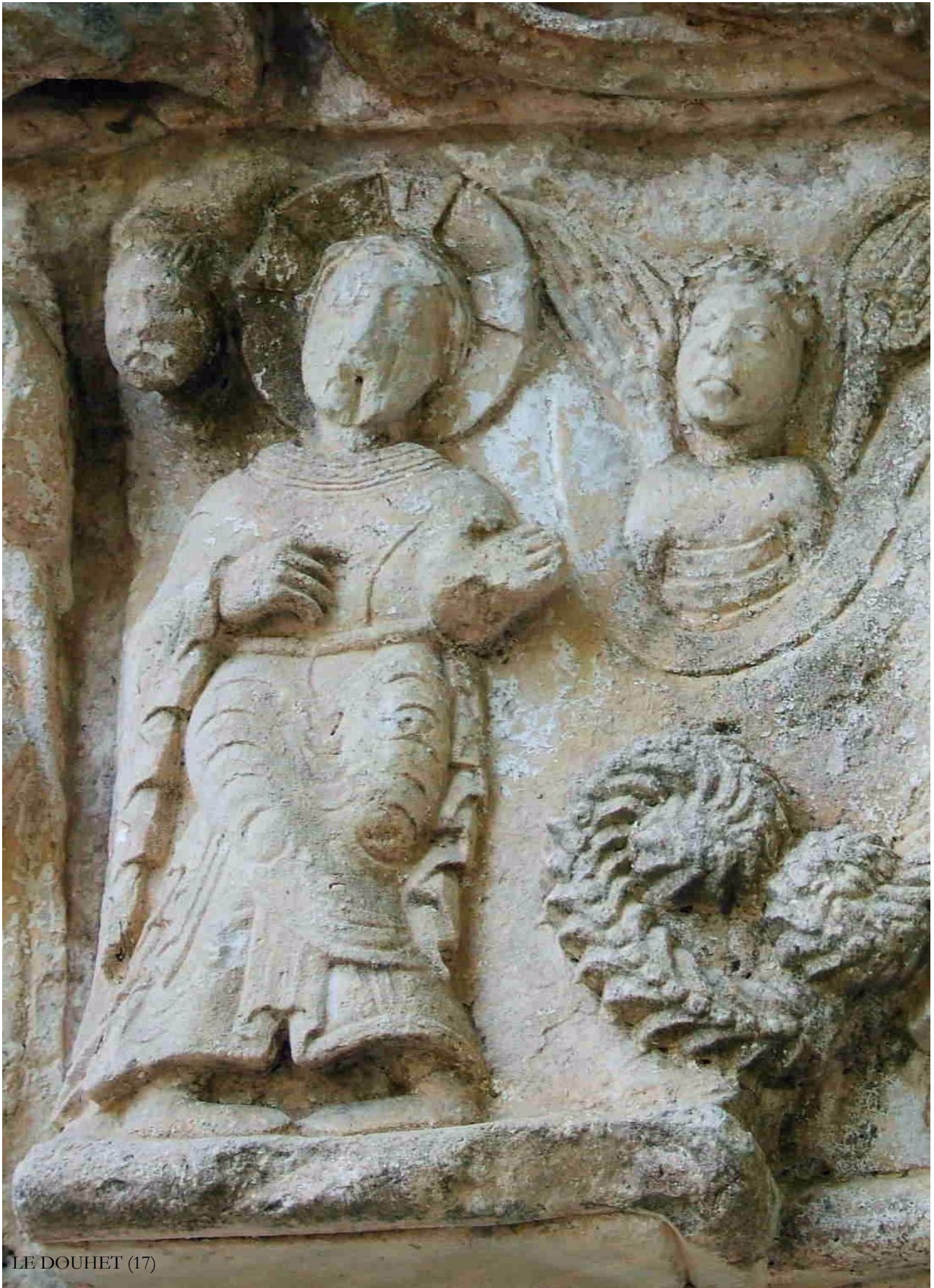
LE DOUHET (17)

Le Christ ne fait pas un pas de dance ... mais délivre un message aux pèlerins, cette sculpture en façade s'adresse à eux !