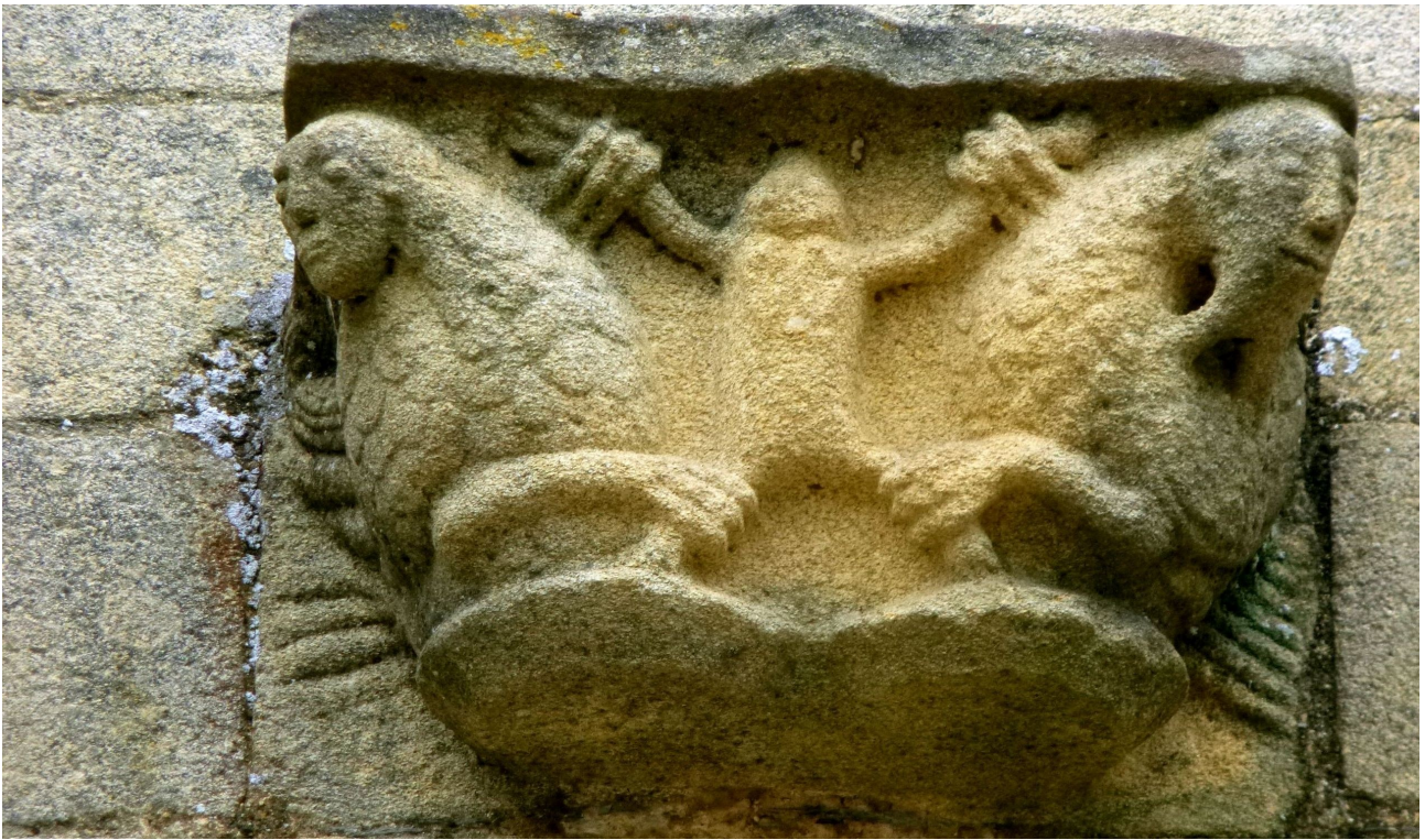
A MALESTROIT en Bretagne, les mains ( actions ) de cette âme sont sous la dépendance de ses vices ou des démons qui les inspirent, et ses jambes sont prisonnières.