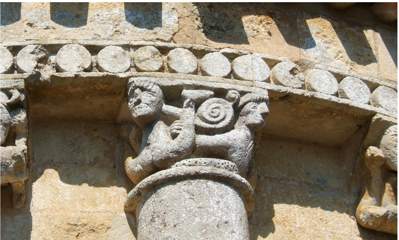
A GIVREZAC (17) ce chapiteau avant-gardiste !!

D'un côté la tête et les jambes ( l'âme marchant vers le ciel )! La conversion en Atlante, difficile !