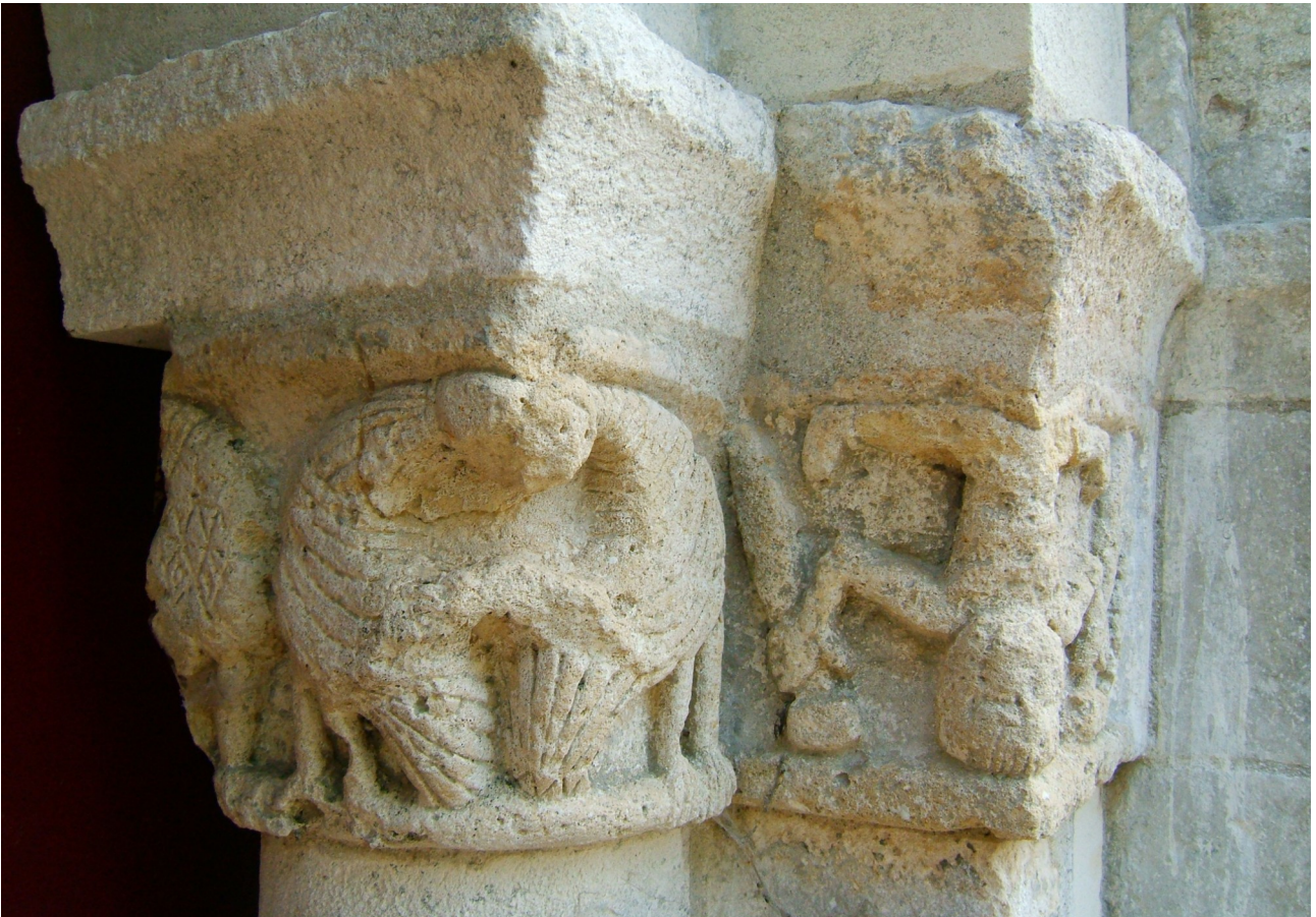
SAINT-COUTANT DU PUY : cet acrobate montre le succès de la démarche spirituelle, celle évoquée par les volatiles sur le chapiteau précédent, tel un pèlerin il marche ....